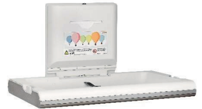
CP0016HCS Polipropileno / Acero inoxidable Acabado satinado