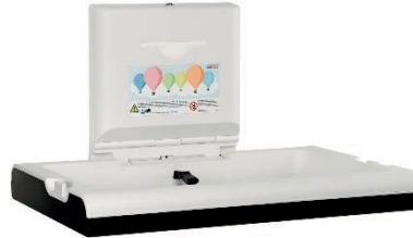
CP0016HCSB Polipropileno / Acero inoxidable Acabado negro mate