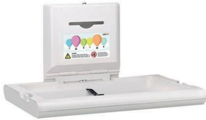
CP0016H Polipropileno Acabado blanco